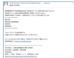
※実際の画面とは異なる場合があります

皆さまからの報告を起点に、厚生労働省、PMDA、製造販売業者など、医療にかかわる人たちが報告情報を活用することで、日本の医療を支えています。